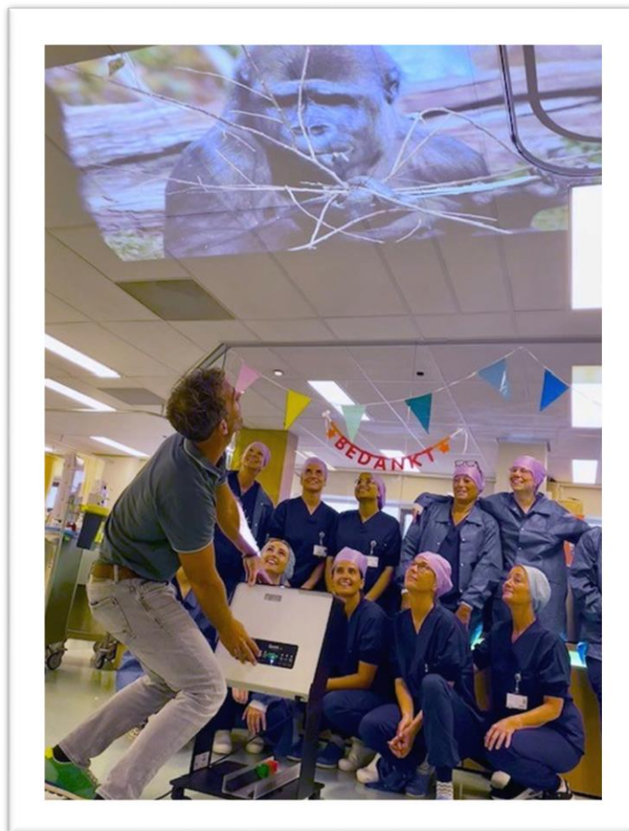
Foto: Zomeractie Vrienden: Qwiek.up projector wordt aangezet op de Recovery Afdeling

Ook schonken we maar liefst vier iPads met geluidsboxen, die meteen in gebruik werden genomen: patiënten genoten samen van de prachtige beelden van Sail Amsterdam. Tot slot werd ook een Silverfit sportapparaat toegekend aan de afdeling Fysiotherapie. Het apparaat zal in 2026 in gebruik genomen worden.