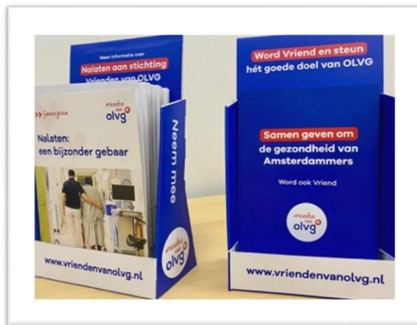
Foto: Bij de ontvangstbalies in OLVG liggen nieuwe folders over Vriend worden en Nalaten aan Vrienden van OLVG

Toegift.nl is een samenwerkingsverband van meer dan honderd CBF erkende goede doelen. Al sinds 2016 voert Toegift een succesvolle landelijke campagne die miljoenen Nederlanders inspireert om na te laten aan een goed doel.