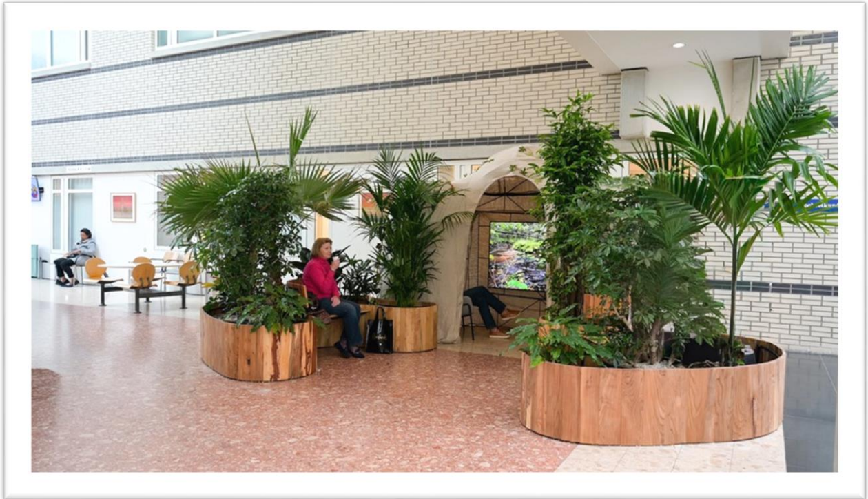
Foto: Healing Oase, Lichtstraat OLVG, locatie Oost