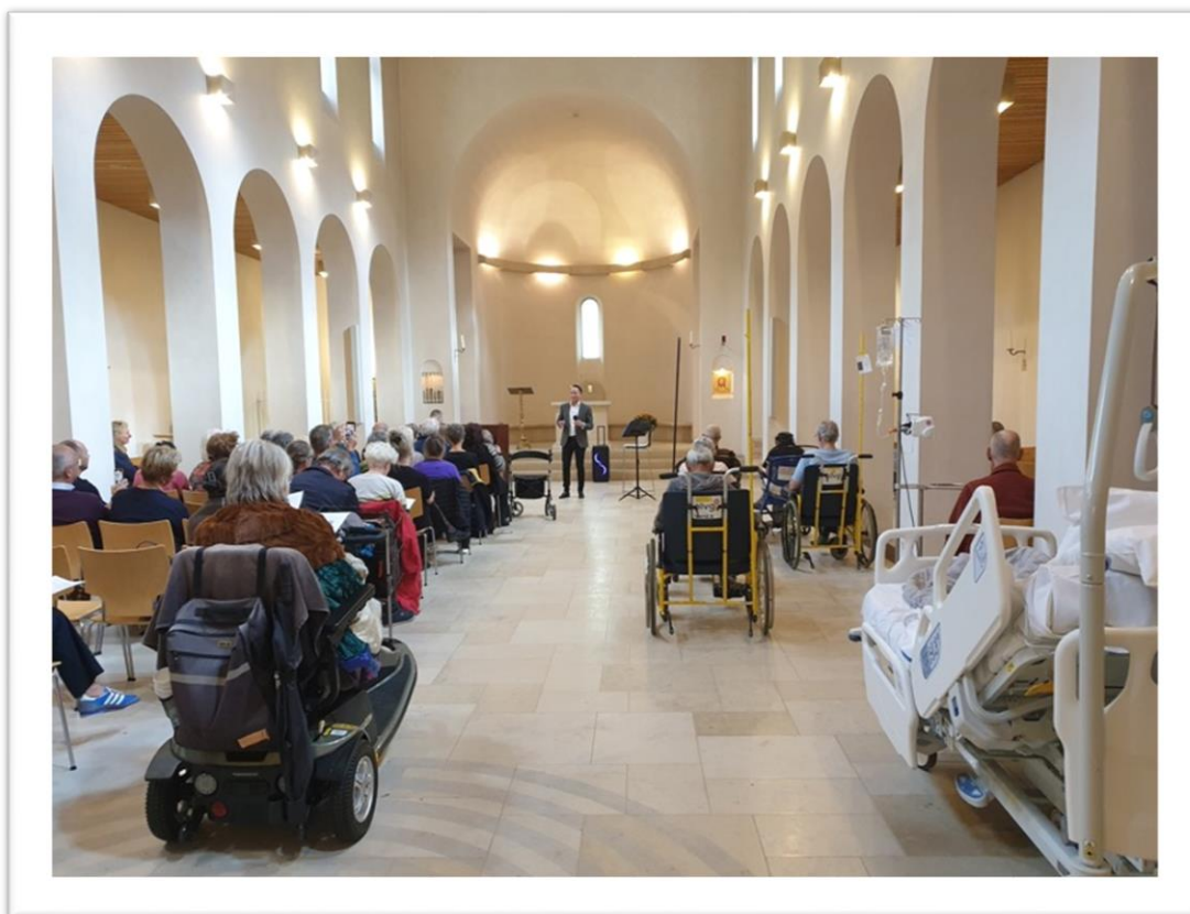
OVG-medewerker zingt Jazzy Songs uit: the American songbook in de kapel, OLVG, locatie Oost in het kader van Muziek project