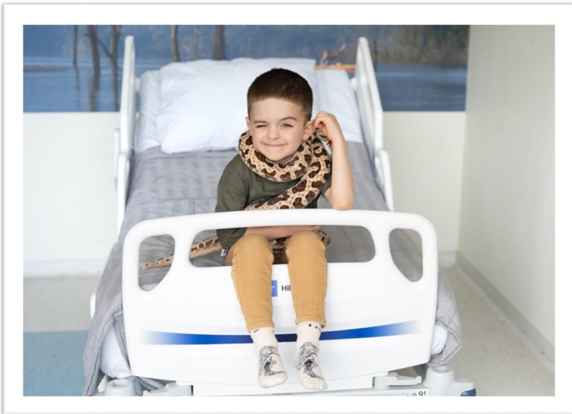
Foto: Patiëntje op de Kinderdagbehandeling