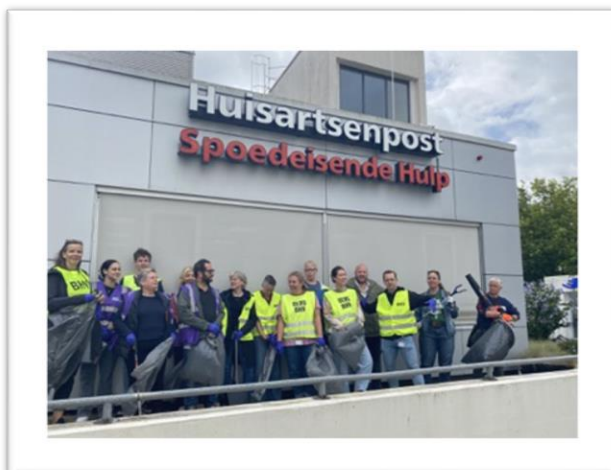
Foto: Clean-up actie buitenterrein OLVG, locatie West

De vorige clean-up actie op locatie West was een groot succes.