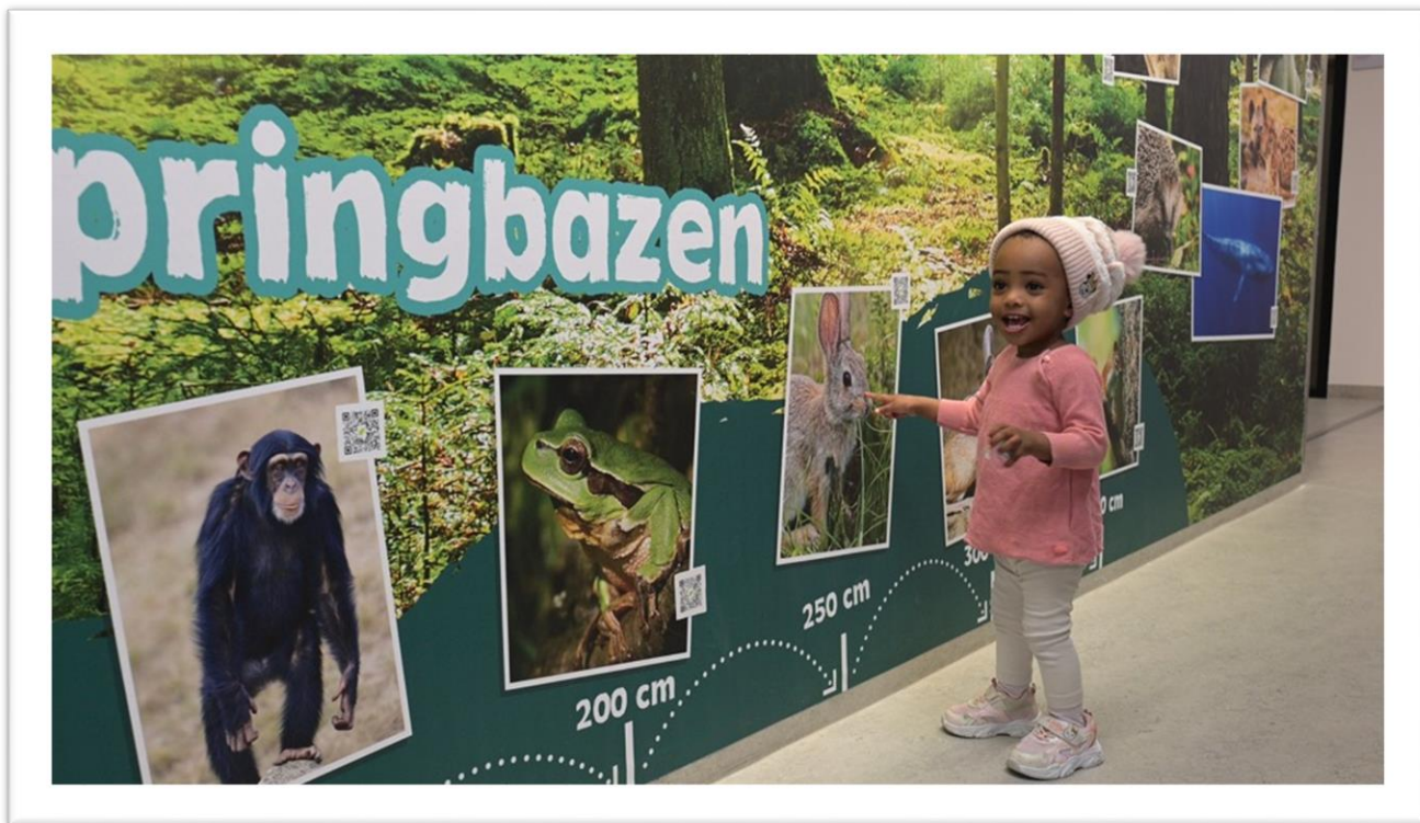
Foto: Patiëntje speelt zoek en vind spel op de muren van de nieuwe Kinderdagbehandeling OLVG

Na een intensieve verbouwing was het eindelijk zover. De vernieuwde kinderdagbehandeling werd op 23 mei 2025 feestelijk geopend.