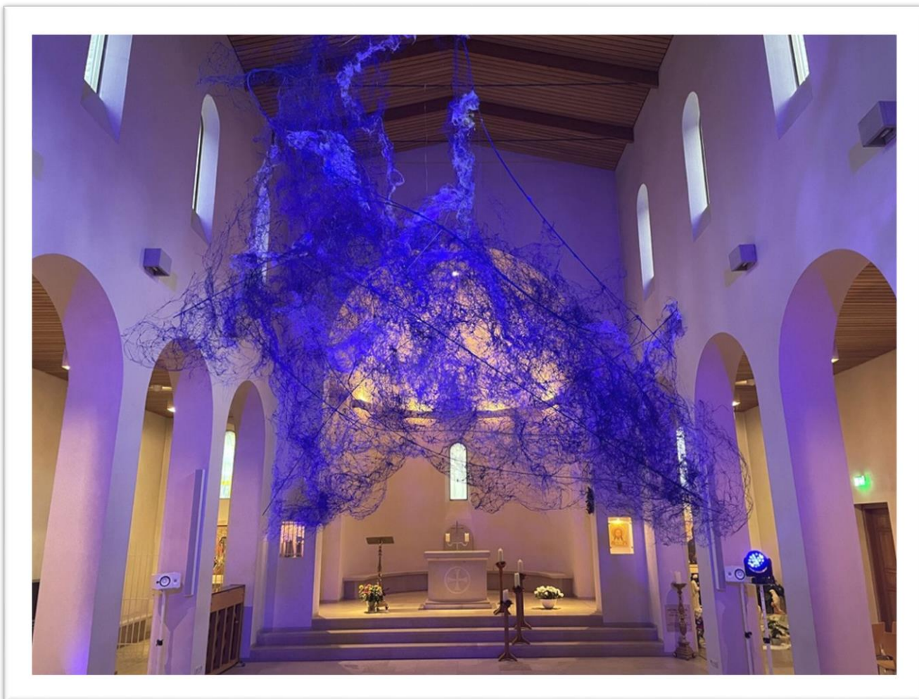
Foto Vrienden van OLVG: Kunstwerk van Susanna Brenner in kapel OLVG, locatie Oost

Onder die wolk van verbinding en hoop vieren we ook dit jaar weer kerstmis op Er kwamen vele bezoekers op af; van patiënten, tot medewerkers en om- en aanwonenden.