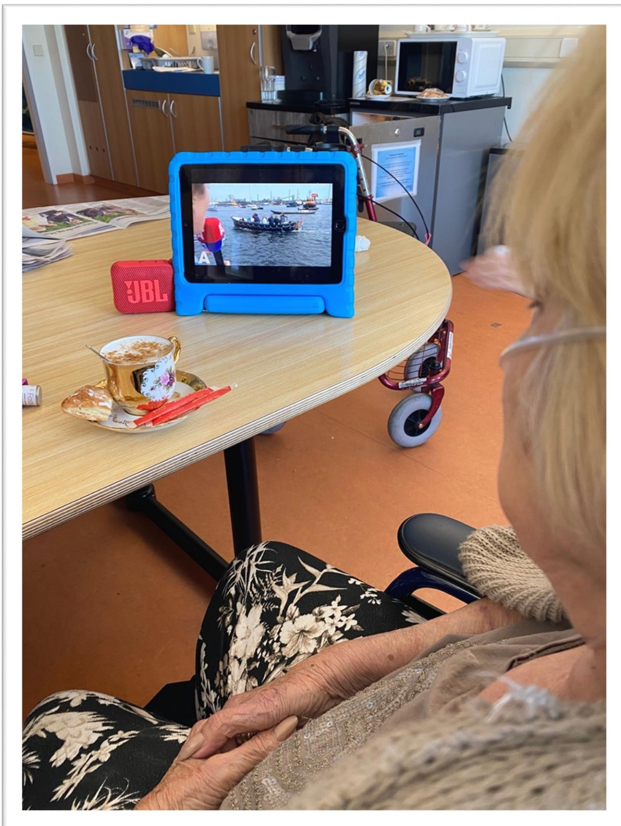
Foto: Zomeractie Vrienden; iPad met boxje op de Geriatrie afdeling worden direct gebruikt door patiënte om Sail Amsterdam te kijken